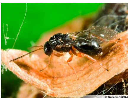
↑ Le cynips du châtaignier