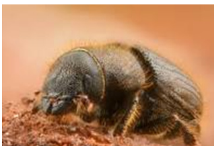
↑ Le dendroctone