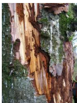
← Dégâts sur sika. Les dendroctones pondent sur une plaie de l'arbre, des œufs dont les larves vont creuser des galeries sous l'écorce et provoquer la mort de l'arbre par dessèchement.