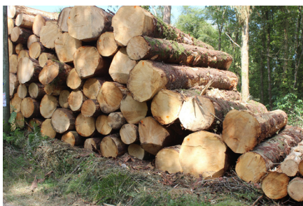
↑ Epicéas de 0,80 m de diamètre et 10 M de long

L'association LEUR AR C'HORNEG prévoit de se réunir courant janvier pour définir ce qui peut se faire. Un bulletin paraîtra au printemps sur la guerre 1939 / 1940 vécue par les locaux. Ce sera le N° 31. Une Assemblée générale se déroulera courant avril / mai.