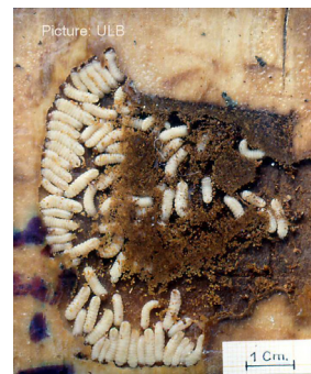
← Larves de dendroctones de l'Epicéa sous l'écorce de l'arbre