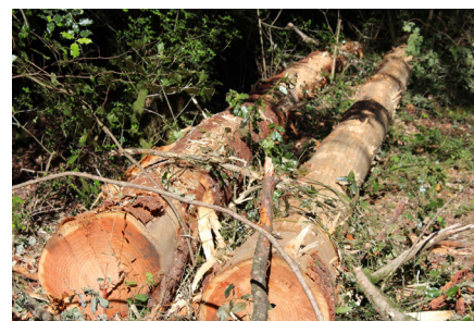
↑ Sapin douglas de 15m