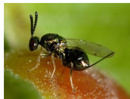
↑ Son prédateur, la microguêpe Torymus sinensis, pond un œuf sur la larve cynips, donnant une larve qui tue son hôte.

Ravageurs et prédateurs sont inter-dépendants