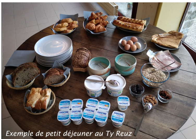
Exemple de petit déjeuner au Ty Reuz