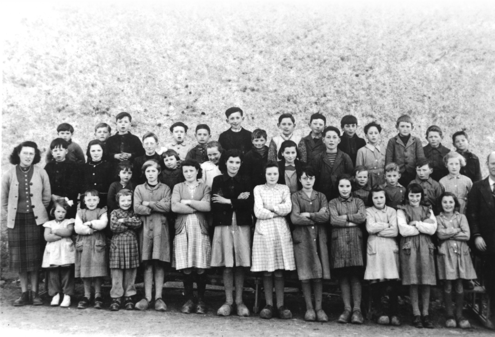
Photo de classe école de St Rivoal année scolaire 1952 / 1953