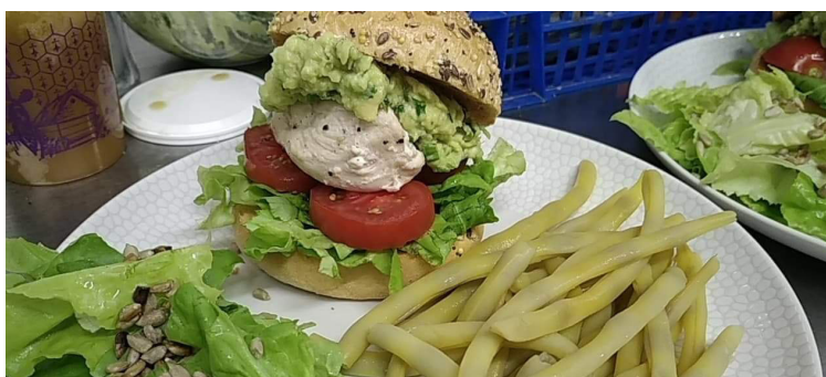
Burger de poulet au guacamole maison, haricots beurre et salade du maraicher