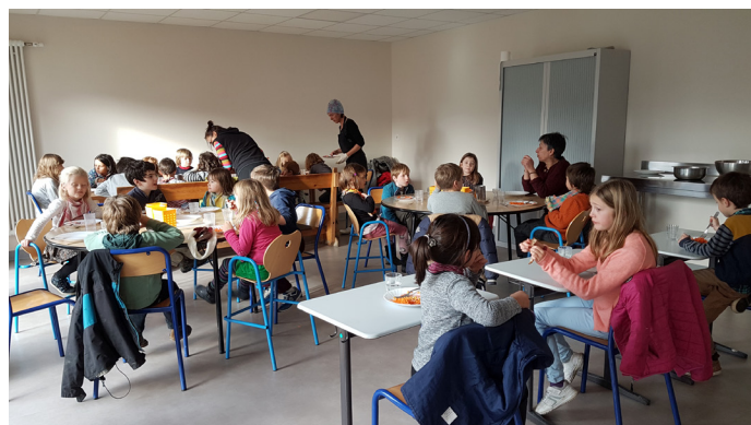
Les enfants dans la nouvelle cantine

Les travaux sur l'école avancent. La classe des grands (dans l'ancien préau) sera bientôt terminée et les enfants mangent désormais dans la nouvelle cantine. Le nouveau préau est en place. L'escalier extérieur qui dessert désormais l'étage est opérationnel.