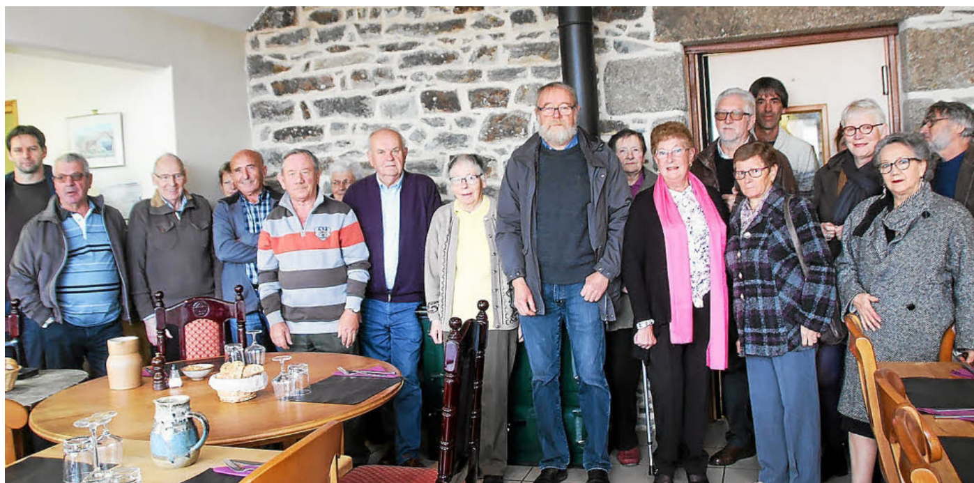
Le repas traditionnellement offert par la commune et le Centre communal d'action sociale (CCAS) aux aînés de plus de 60 ans s'est déroulé le dimanche 22 octobre à l'auberge du Menez. Les convives ont ainsi pu apprécier le dernier repas servi par Annouck, avant la fermeture de l'auberge.